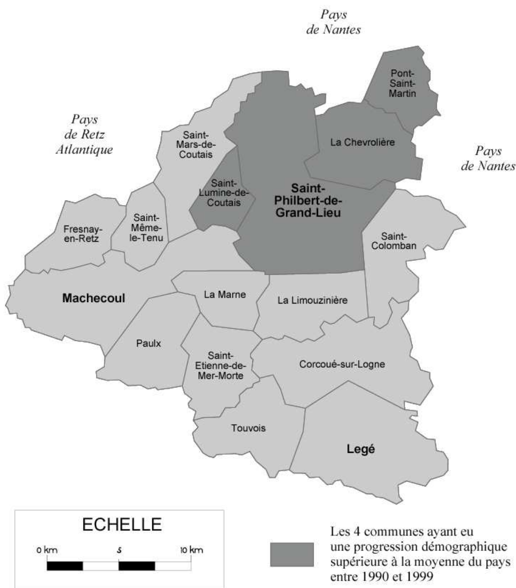
Carte II – Présentation des communes du pays de Machecoul et Logne

Il est très intéressant de souligner le fait que la Loire-Atlantique est, avec l'Ille-et-Vilaine, le seul département breton où la proportion des brittophones par rapport à l'ensemble de la population est équilibrée dans les différentes classes d'âges 1 .